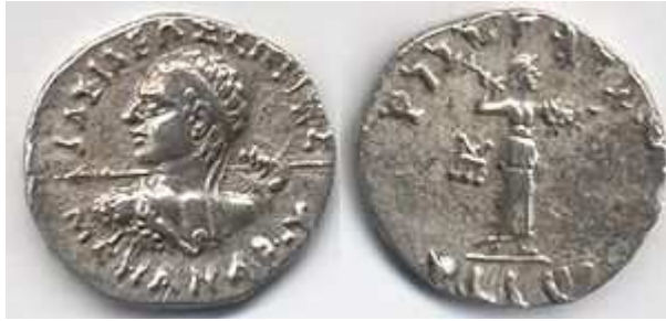
ဂရိ ငွေဒင်္ဂါး မင်းနန္ဒာ (၁) ဘီစီ ၁၆၀-၁၃၅

ဘီစီ ၃၂၆ ခု ပတ်ဝန်းကျင်တွင် အလက်ဇန်းဒြား သည် ဂရိတ် သည် ယနေ့ခေတ် အာဖဂန်နစ္စတန် နိုင်ငံဖြစ် သည့် ဘရက်တီးယားကို အောင်နိုင်သိမ်းပိုက်ပြီးချိန်မှ စ၍ ဂရိဘုရင်ပိုင်နိုင်ငံမှာ အိန္ဒိယအနောက်ဘက်ပိုင်းနှင့် အိမ်နီးချင်း ဖြစ်လာခဲ့သည်။ ပထမပိုင်း ဘီစီ ၃၂၃ ခန့်တွင် ဆီလူးစ် နိုင်ငံမှသည် နောက်ပိုင်း ဘီစီ ၂၅၀ ခန့်မှစ၍ ဂရိ-ဘရက်တန် ဘုရင်နိုင်ငံဖြစ်လာခဲ့ပေသည်။