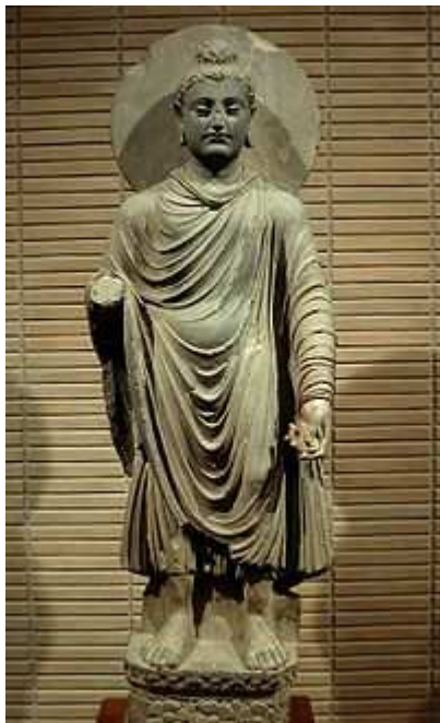
အေဒီ ၁-၂ ရာစု ဂန္ဓရဒေသရှိ ရှေးဦး ပထမ ဗုဒ္ဓရုပ်ပွားများမှ တစ်ခုဖြစ်သည့် ဂရိ-ဗုဒ္ဓ ဆင်းတု

ဘီစီ ၃၂၆ ခု ပတ်ဝန်းကျင်တွင် အလက်ဇန်းဒြား သည် ဂရိတ် သည် ယနေ့ခေတ် အာဖဂန်နစ္စတန် နိုင်ငံဖြစ် သည့် ဘရက်တီးယားကို အောင်နိုင်သိမ်းပိုက်ပြီးချိန်မှ စ၍ ဂရိဘုရင်ပိုင်နိုင်ငံမှာ အိန္ဒိယအနောက်ဘက်ပိုင်းနှင့် အိမ်နီးချင်း ဖြစ်လာခဲ့သည်။ ပထမပိုင်း ဘီစီ ၃၂၃ ခန့်တွင် ဆီလူးစ် နိုင်ငံမှသည် နောက်ပိုင်း ဘီစီ ၂၅၀ ခန့်မှစ၍ ဂရိ-ဘရက်တန် ဘုရင်နိုင်ငံဖြစ်လာခဲ့ပေသည်။