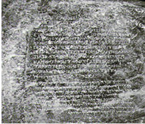
အာသောကမင်း၏ ဂရိ အာရာမစ် နှစ်ဘာသာ ကမ္ဘည်းကျောက်စာ (ကန်ဒဟာ၊ ကဘူးလ် ပြတိုက်)

အာသောက၏ အချို့သော အထောက်အတော်များသည် ဂရိလူမျိုးများ ဖြစ်သည်ဟူသည့် အချက်ကို သဘောထား ကိုက်ညီသည့် ဒေါက်တာ ရာနန်ဂျစ်ပေါလ်၏ စူးစမ်းမှုဖြစ်သော “အာသောကသည် အင်ဒို-ဂရိဘုရင် ဒီယို ခိုး တပ် နှင့် အတူတူပင်။ သူသည် ဓမ္မသတ်များကို ဂရိဘာသာစကား၊ အာရာမစ် ဘာသာ စကားများဖြင့် ရေးထိုး ခဲ့၏။ ၎င်းတို့အနက် တစ်ခုမှာ ကန်ဒဟာ ကျောက်စာတွင် ဖော်ပြသည့် ဘာသာရေး ကိုင်းရှိုင်းမှု ဟူသည့် ဂရိ ဝေါဟာရ “ယူစီဘီးယား” အသုံးဖြစ်၍ “ဓမ္မ” အတွက် သုံးခြင်းပင်” ဖြစ်၏။ ၎င်းမှာ-