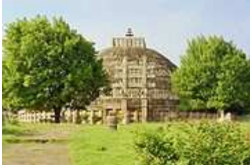
အိန္ဒိယနိုင်ငံ ဆန်ချီ အရပ်မှ ဌာပနာတိုက်ကြီး (ဘီစီ ၃ ရာစု)

မောရိယ ပြည့်ရှင် အာသောကမင်းကြီး (ဘီစီ ၂၇၃-၂၃၂) သည် အိန္ဒိယပြည် အရှေ့ပိုင်း ယခုခေတ် အော်ရစ်သျှ ဟုတွင်သည့် ကလိင်္ဂနယ် ကလိင်္ဂသွေးချောင်းစီး စစ်ပွဲအား အောင်နိုင်ပြီးနောက် ဗုဒ္ဓဘာသာသို့ ကူးပြောင်းခဲ့ ပေသည်။ စက်ဆုတ်ရွံ့ရှာဖွယ် ပဋိပက္ခများကို နောင်တရလျက် မင်းကြီးသည် ပြသနာ အရေးအခင်းများကို စွန့်လွှတ်ရန် ဆုံးဖြတ်ခဲ့ပြီးနောက် ဌာပနာတိုက်များတည်ဆောက်ခြင်း သတ္တဝါအားလုံး၏ အသက်ဇီဝအား လေးစားကြရန် မှတ်တိုင်များစိုက်ထူခြင်း လူသားတို့အား ဓမ္မတရားအား လိုက်နာစေရန် တိုက်တွန်း နှိုးဆော်ခြင်း များအားဖြင့် သာသနာပြုခဲ့သည်။ သူသည် နိုင်ငံအဝှမ်း လမ်းများဖောက်လုပ်ခြင်း ဆေးရုံများ၊ ရိပ်သာများ၊ တက္ကသိုလ်ကျောင်းများ၊ တူးမြောင်းများ တည်ဆောက်ခြင်းများလည်း လုပ်ဆောင်ခဲ့ပေသည်။ သူသည် လူမျိုး ဘာသာ ဂိုဏ်း ဇာတ်စနစ်များ မခွဲခြားဘဲ တန်းတူ ဆက်ဆံခဲ့ပေသည်။ ဤကာလသည် ဗုဒ္ဓဝါဒမှာ အိန္ဒိယမှ ကျော်လွန်လျက် အခြားတိုင်းပြည်များသို့ ဦးစွာ ပထမပြန့်နှံ့သွားသော ကာလပင်ဖြစ်၍ အာသောကမင်းကြီး ချန်ထားခဲ့သော ကျောက်ပြား ကျောက်စာများအရ တောင်ဘက် သီရိလင်္ကာ၊ အနောက်ဘက် ဂရိဘုရင် နိုင်ငံများအထိပင် ဗုဒ္ဓသာသနာပြုရန် သာသနာပြု အဖွဲ့များ စေလွှတ်ခဲ့ကြောင်းတွေ့ရ၍ မြေထဲပင်လယ် ရပ်ဝှမ်းထိပင် ပေါက်ရောက်ခဲ့ဟန်ရှိပေသည်။