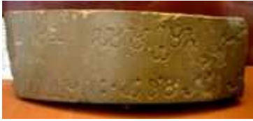
ဘရာမီ မှ အာသောကရာဇာ၏ အမိန့်ပြန်တမ်း အမှတ် ၆ သံကျောက်တိုင်မှ အပိုင်းအစ (ဘီစီ ၂၆၅)၊ ဗြိတိသျှ ပြတိုက်